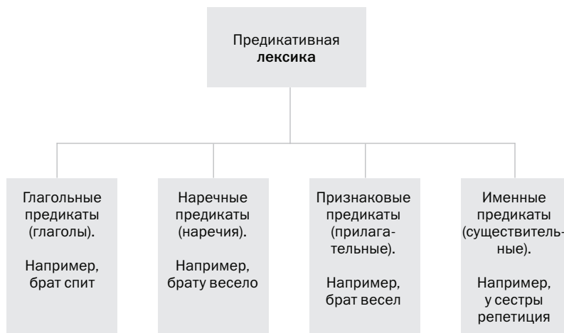
Схема 1. Классификация предикативной лексики (по Г.А. Золотовой)

Л.М. Васильев предикативную (предикатную) лексику систематизировал по доминирующим лексическим компонентам значений. Автор понимает под предикативной лексикой сложно структурированную языковую организацию, которая включает существительные, глаголы, прилагательные, наречия и др. Л.М. Васильев, классифицируя данный пласт лексики, выделял два основных типа предикатов: бытийные (по доминирующему компоненту « быть » или « не быть ») и акциональные (по доминирующему компоненту «осуществлять, совершать какое-либо действие, делать что-либо или по тому же компоненту с отрицанием»).